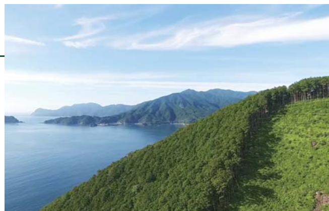
熊野灘に面したヒノキ林

この山岳地帯から海岸部までの距離は10～15km程度であり、斜面傾斜が非常に大きく、海岸部から急斜面の山頂に至るまで見事にヒノキが植えられた景観は全国的にも珍しく、優れたランドスケープを形成しています。